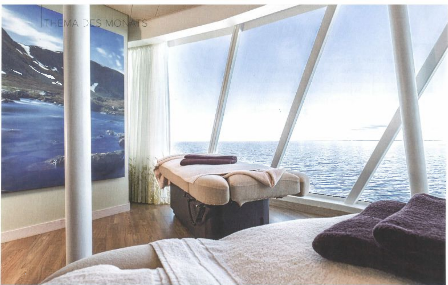
Die Spa-Kabine für zwei auf dem Schiff: Da möchte man eigentlich nur liegen und schauen